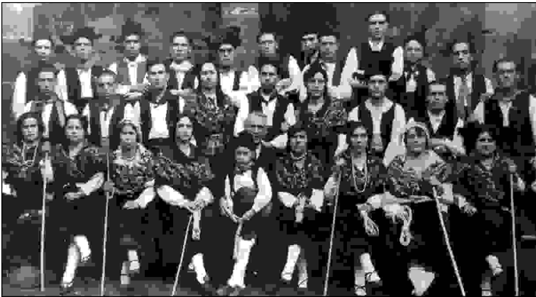
Grupo Cántigas e Amoríos .

Dende ese intre non se volve a falar da obra. Ninguén sabe dela, coñécense partes e moi vagamente; quedalle trocado o nome polo de “ Estreliña ” como se fose o auténtico e só se nomea como algo que desapareceu e que reunía moita expresividade anímica, tanto na poesía que a conformaba coma na melodía que a espallaba.