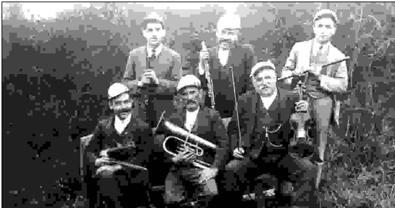
Grupo familiar musical en San Miguel de Bremao.