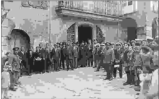
Acto político, 1929

tomando posesión definitiva o alcalde e os concelleiros o 26 de xuño (ver CADRO II), con dez representantes dos partidos nidiamente republicanos (ORGA, PSOE) e cinco do “ partido del orden ”, nese momento o Partido Radical . Entre as medidas que foi tomando esta corporación municipal -preparadas máis nunha rebotica e nun bufete que na propia casa do concello- destacan a recualificación dos contribuíntes aos “consumos” con rebaixas ou eliminación de taxas aos veciños de poucos ingresos, a ampliación do que hoxe denominamos Servicios Sociais, a redución a oito horas da xornada laboral dos