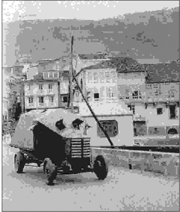
Camión Blindado, 1936.

intensas en automóviles e polos telefonémas da época, e asemade coa dotación do “Torpedeiro nº 2” que, sen carbón para a súa máquina despois de fuxir de Ferrol e navegar até A Coruña, estivo fondeado diante do castelo de Redes ata que foi apresado o día 21 polo barco sublevado Uad-Martín. Os sublevados -triumfantes en Ferrol- querían achegarse cara a Pontedeume, pero un primeiro intento o día 21 fracasou nos altos de Laraxe; ás 8 da mañá do día 23 unha columna mandada polo comandante Iglesias e o capitán Gallego (con el cinco tenentes, oitenta soldados, quince gardías civís, dez falanxistas e un camión blindado con tres ametralladoras), avanzou pola estrada de Sillobre e Lavandeira, chegando á vista de Pontedeume ás once: houbo un