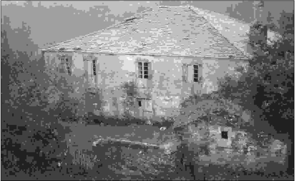
Arriba: Casas da Ínsua (O Freixo). Abaixo: Casa rectoral de O Freixo.