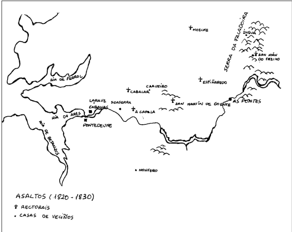
Rexistro de asaltos de bandoleiros na Comarca do Eume entre os anos 1820-1830.