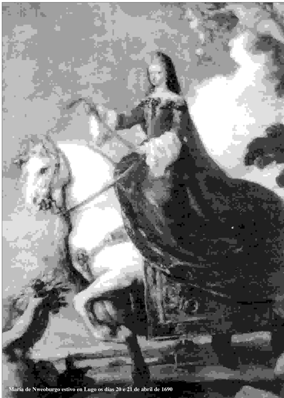
María de Nweoburgo estuvo en Lugo os días 20 e 21 de abril de 1690