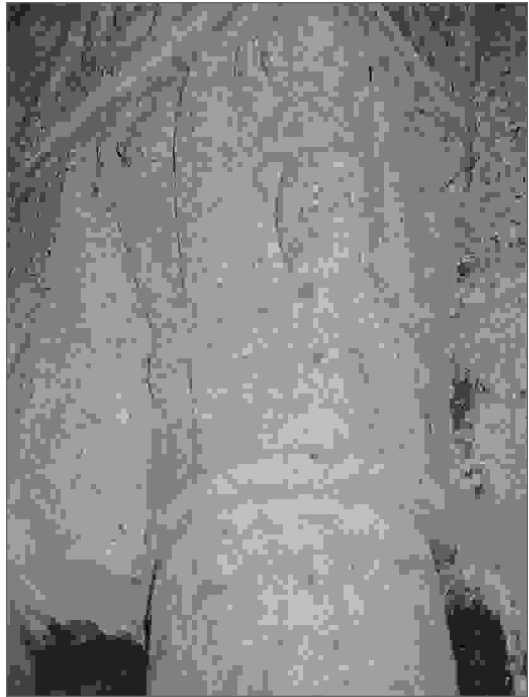
Capitel del soporte norte de la portada de poniente.

La fachada sur, se nos presenta como un gran lienzo mural totalmente desnudo, cuyo coronamiento está determinado por una cornisa, moldurada en listel, baquetilla y caveto, todos ellos lisos, apeada en tres canecillos, de curva de nacela 51 , situados, dos de ellos en los extremos, es decir, a continuación del estribo y en el codillo, haciéndolo el restante hacia el comedio del alero.