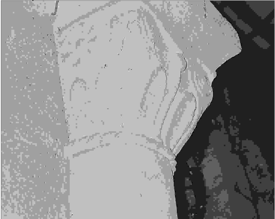
Detalle del capitel derecho del arco triunfal.

El ábside, constituido por un tramo recto que precede a otro curvo, se cubre con una bóveda de cañón semicircular, mientras que el hemicíclo, de menor altura y anchura, lo hace con otra de cascarón u horno.