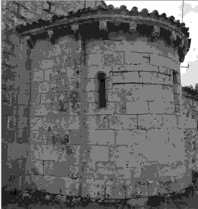
Cabecera de la iglesia.

Los paramentos están contruidos con un aparejo de sillería granítica, de grano fino perfectamente tallado, colocado en hiladas horizontales con juntas esmeradamente dispuestas e isodormía bastante acusada, abundando los emplazados a soga sobre los tizones. En tanto que su espesor es muy estimable, presentado la misma sección los correspondientes a la nave 36 y los del ábside.