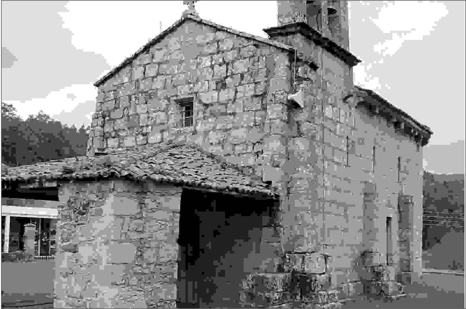
Pórtico y hastial de poniente.

tacado un conjunto de rasgos, como su marcada simplicidad o la acusada austeridad, que se evidencian de una manera especial en la nave, así como el empleo sistemático de elementos vegetales o geométricos en la decoración, salvo el del capitel septentrional de la portada principal y el de algún canecillo del alero de la fachada sur de la nave, aspectos que, incorporados al apuntamiento que ofrecen la arquivolta y chambrana, de la aludida puerta de poniente, y la ausencia de compartimentación de la zona semicircular del ábside, nos inducen a pensar, en unas fórmulas constructivas y ornamentales, que nos remiten inexorablemente a las utilizadas en las edificaciones de los últimos años de la duodécima centuria y primeros de la siguiente, período de tiempo en donde tiene lugar la transición del tardorrománico al gótico.