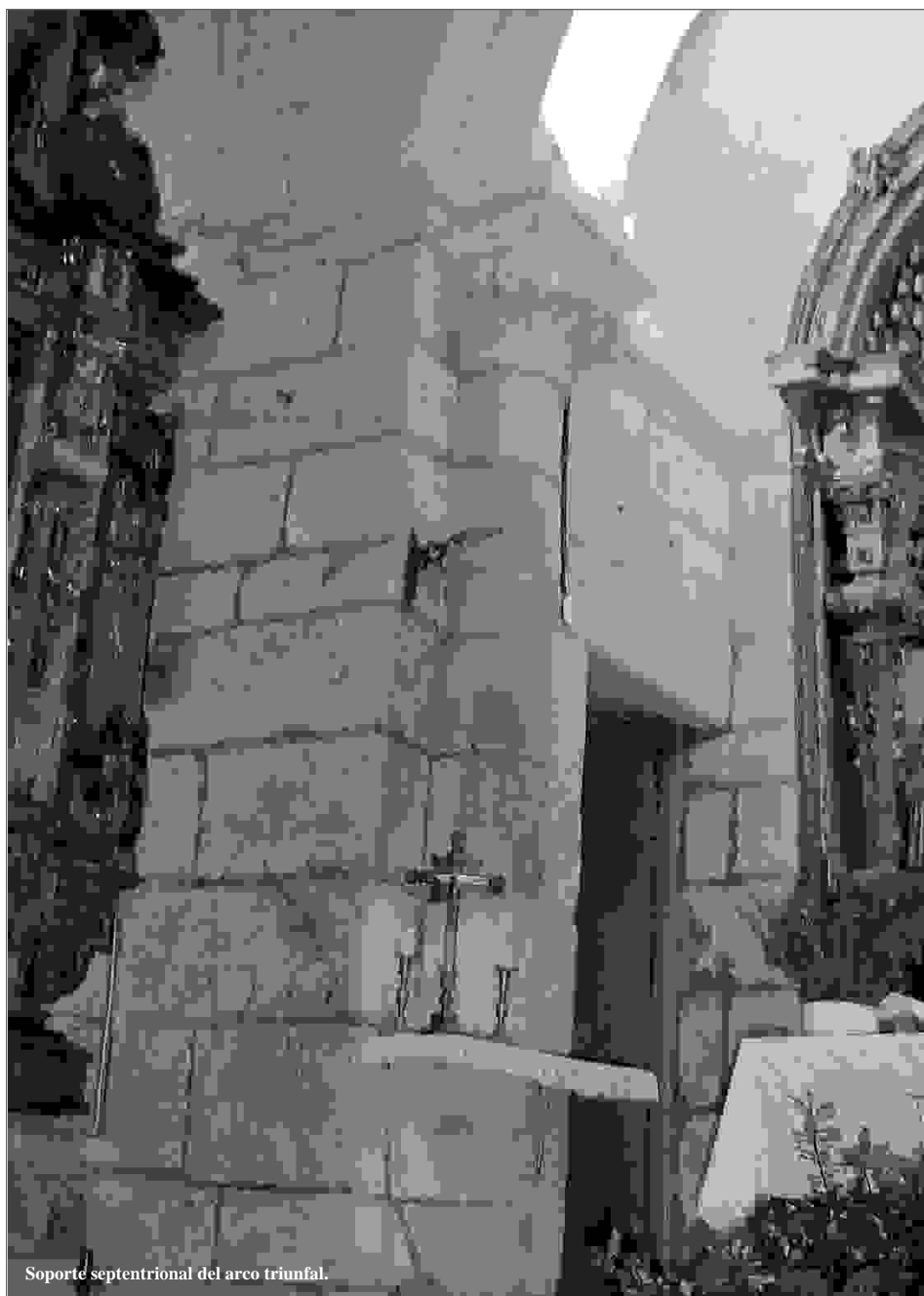
Soporte septentrional del arco triunfal.