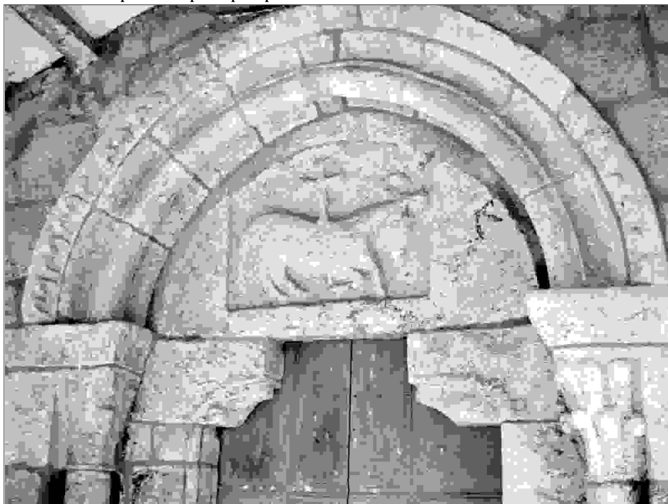
Detalle de la zona superior de la puerta principal.

En cada una de las zonas central, nororiental y suroeste del tambor de la mencionada parcela semicircular, se dispone una ventana, de acusado derrame interno, compuesta por un arco de medio punto, apoyado directamente en las jambas, éstas y aquél molduradas en arista viva, de las cuales prevalecen con su organización primitiva la que ocupa la zona suroriental, ya que la central fue alargada presentando su coronamiento rectangularizado, y la restante está tapiada a resultas de la construcción de la dependencia que acoge la sacristía, adosada, como ya se comentó más arriba, al costado septentrional del presbiterio. Vanos cuya misión consistía, en sus orígenes, el proveer de luz natural a la cabecera, iluminación que quedó un tanto alterada, como consecuencia del emplazamiento del retablo, paliándose, en parte tal efecto al suprimir el cierre posterior de los nichos del mismo, que se corresponden con aquéllas.