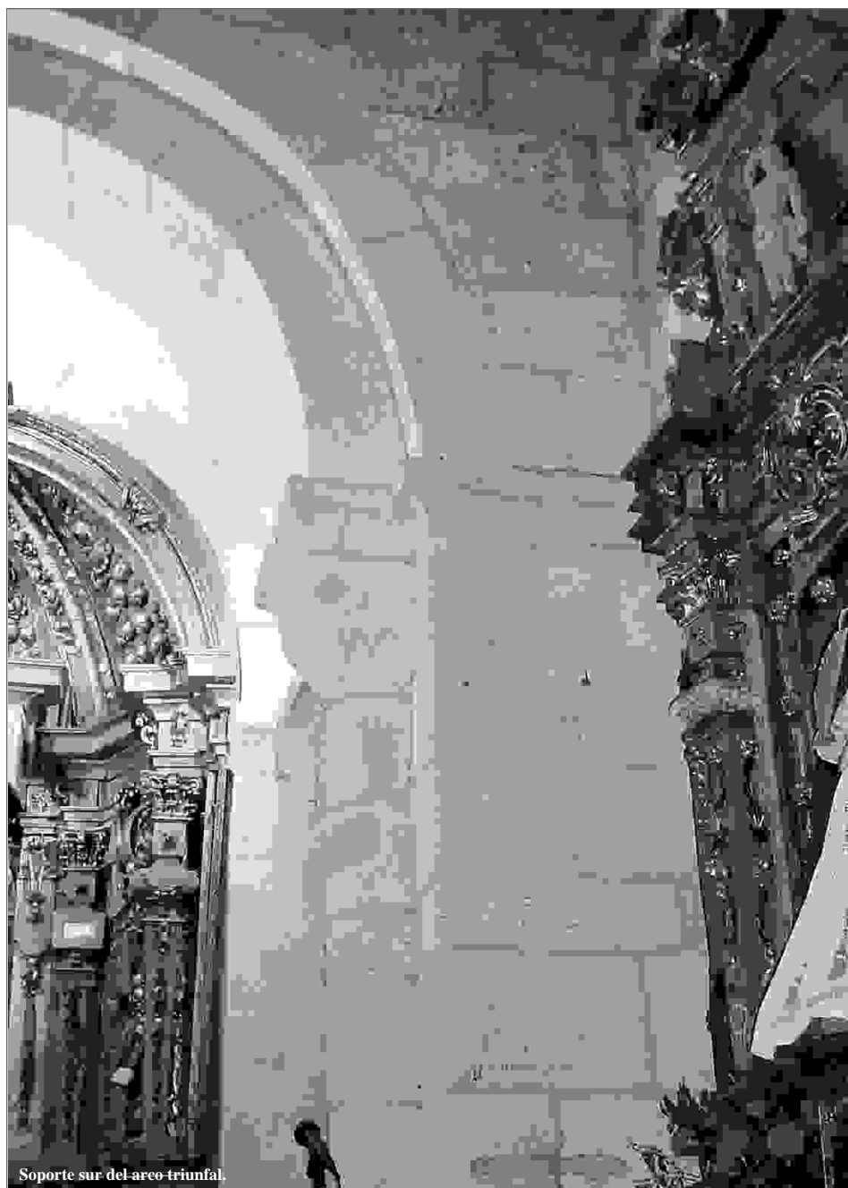
Soporte sur del arco triunfal.