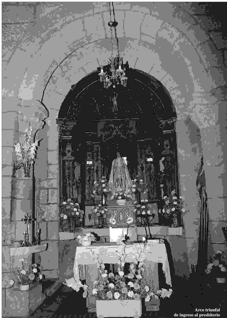
Arco triunfal de ingreso al presbiterio