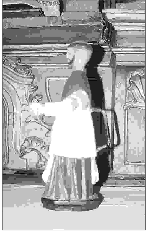
Imaxe do San Ramón pequeno.