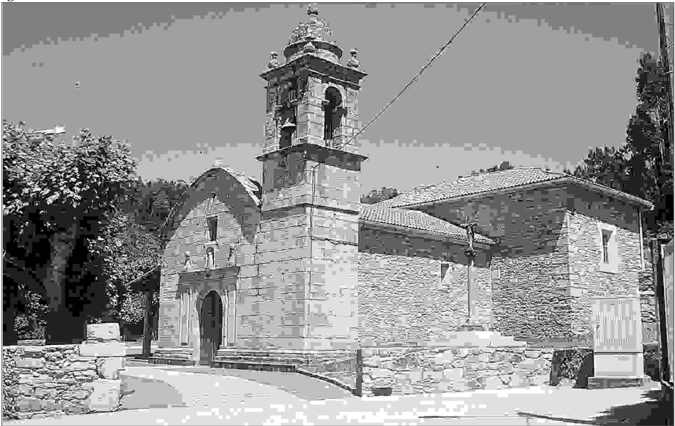
Igrexa de Santa Mariña de Sillobre.

Ao contrario do que sucede na maior parte das parroquias de Fene, en Sillobre non se procedeu a crear ningunha festa ex novo nos últimos anos. A tipoloxía destas novas festas en Fene é moi interesante e responde a perspectivas de innovación moi diversas: danse iniciativas de tipo gastronómico como a festa da Orella en Limodre ou de tipo laico como a romaría do Pote en Maniños ou a festa do Camiñante Descoñecido en Barallobre. O que si se ten producido en Sillobre é a prolongación dalgunha das festas a un día máis con algunha peculiaridade neste ocasión tamén de tipo