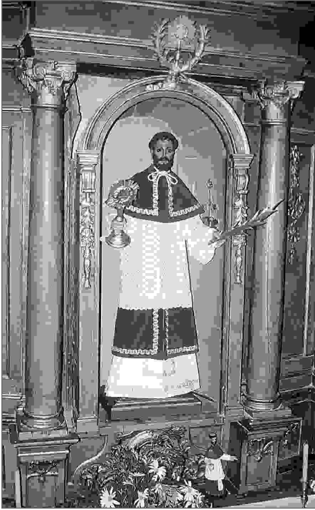
Imaxe de San Ramón Nonato.