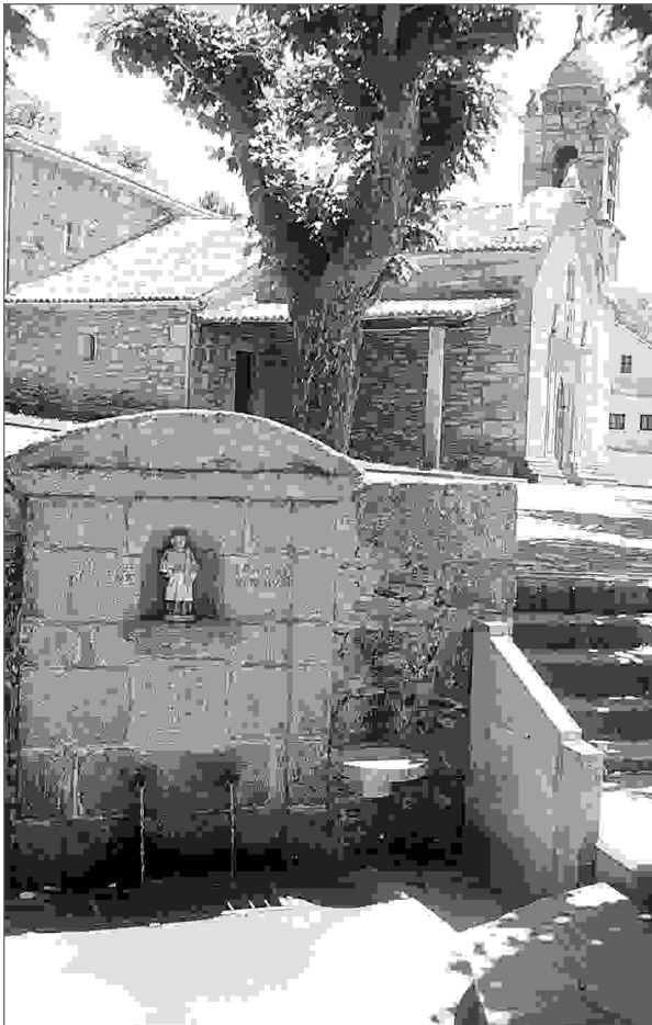
Fonte de San Ramón e Santa Mariña.

Do conxunto de festas celebradas na parroquia de Sillobre dende a perspectiva dos propios veciños sen dúbida a festa máis significativa é a da patroa, Santa Mariña, seguida polo San Ramón. Estas dúas son as referencias festivas máis relevantes entre os veciños, pero sempre marcando a diferenza de natureza entre elas: unha é a festa patronal e a outra é unha romaría. "A patrona é Santa María, pero como o San Ramón... e que era moito, tanta xente... por todas partes..." .