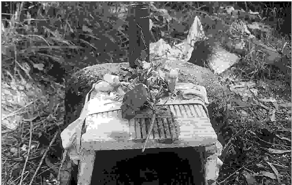
Detalle dos restos de velas e ofrendas deixadas no marco.

Antes de deixar o lugar e de voltar para a casa seguindo outro camiño diferente ao utilizado para a ida (é algo que cómpre recordarmos), hai que deixar unha esmola ao santo nas proximidades do marco e tamén algunha prenda do ofrecido, especialmente nos casos en que este, debido á enfermidade que poida sufrir, ou a que prefira non asistir persoalmente ou a algunha outra razón, non puidera ir por el mesmo ata este lugar.