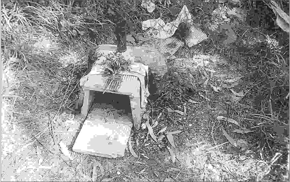
Estado actual do marco de San Lourenzo.

que procuran a curación dunha enfermidade, ben propia ou ben dun familiar ou coñecido, ou a superación dun mal de ollo froito da envexa, ou a consecución dun desexo vital primordial, seguindo uns rituais fixos e establecidos moi claramente desde xa hai moito tempo atrás. Estamos vendo como se lle continúan outorgando a este espacio liminal uns valores simbólicos que lle proporcionan ao marco de San Lourenzo un significativo lugar na xeografía moral dos veciños desta zona.