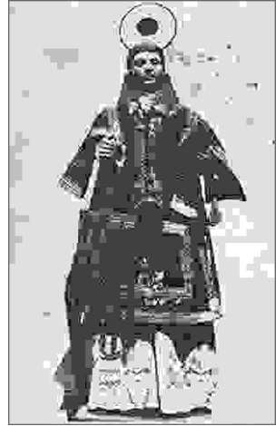
Antiga imaxe de San Lourenzo.

Actualmente a imaxe de San Lourenzo que se garda na igrexa de Laraxe non é a mesma que protagonizou esta historia. A antiga imaxe deste santo, máis modesta que a actual, está depositada nunha casa particular de Laraxe, pois hai xa moitos anos foi sorteada entre os veciños da parroquia para conseguir fondos cos que mercar outra escultura máis moderna. Esta figura máis actual é a que hoxe se pode contemplar no altar maior da igrexa de San Mamede.