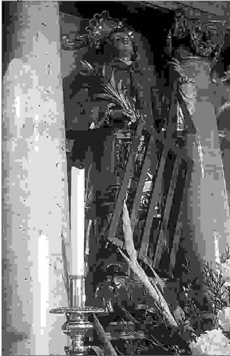
Imaxe de San Lourenzo gardada na igrexa de San Mamede de Laraxe.

sideraban como algo propio, pensaron outra solución que lles permitira acabar con todas estas probables polémicas e quedarse eles definitivamente co San Lourenzo. Mentres ían polo camiño para Laraxe matinando nestas cuestións un deles atopou a mellor solución. Colleron unha pouca lama e mancharon con ela os pés do santo finxindo que este andara só polos camiños enlameados. Esa sería a proba necesaria para convencer aos de Maniños de que o San Lourenzo quería quedar en Laraxe e que tantas veces como o levaran para Maniños, voltaría pola noite a Laraxe aínda que estivera chovendo e tivera que manchar os pés. E acertaron coa solución xa que, cando os de Maniños viron que o San Lourenzo " marchara " el só desde a súa igrexa andando ata Laraxe, quedaron convencidos de que este santo pertencía á parroquia veciña xa que el quería estar alí. Por tanto era nese lugar onde debía celebrarse a súa romaría. Nunca máis voltaron a reclamar o santo e tamén eles asisten todos os anos ás festas de Laraxe e a romaría de San Lourenzo.