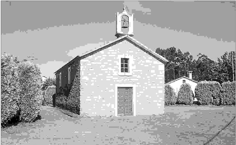
Capela de San Marcos.

Así mesmo entre os concellos de Monfero e Vilarmaior está situado o marco da Cartelida que, ao igual que o marco de San Lourenzo, marca o límite entre catro parroquias desta bisbarra: San Xurxo de Queixeiro e Santa María de Vilachá no concello de Monfero, San Pedro de Grandal en Vilarmaior e a parroquia de Santa Mariña de Taboada que está repartida entre os concellos de Monfero, Vilarmaior e mais Pontedeume. Ao redor deste marco todavía pervive un rico ritual destinado á curación dos meigallos e de todos os males que poida provocar a envexa e o mal de ollo. O seu desenvolvemento é moi similar ao que se realiza para acudir ata o marco de San Lourenzo 4 .