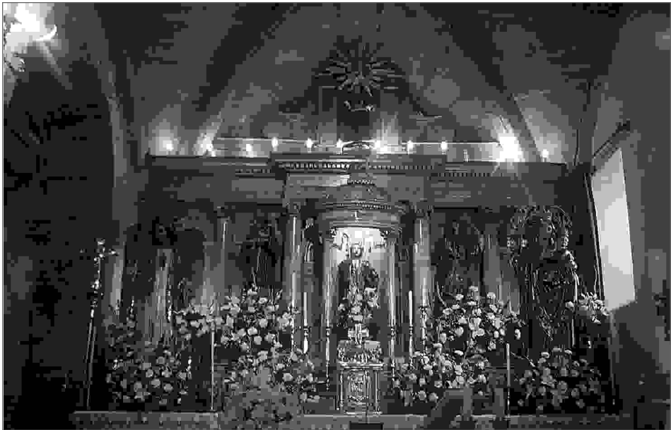
Altar maior da igrexa de Laraxe con algunhas das imaxes gardadas no seu interior. A escultura central é de San Mamede.

Todos os días das festas, despois das alboradas dos gaiteiros e das bombas de palenque, comezaban e comezan coa misa oficiada na igrexa parroquial. Posteriormente saían algunhas das imaxes que están gardadas na igrexa en procesión polo camiño situado ao redor do templo. No día de San Mamede era a imaxe deste santo a que encabezaba esta procesión, despois de el, acompañándoo, as esculturas de San Lourenzo, San Antonio e San Xosé, pechando sempre a comitiva a Virxe da Candieira. O resto das imaxes gardadas na igrexa non saía na procesión. No día de San Lourenzo saía a procesión coas mesmas catro imaxes, aínda que mudaban as súas posicións, xa que San Mamede deixaba o seu lugar no comezo do cortexo á imaxe de San Lourenzo. O día once, durante o que se celebraba o Corpus Christi, ía só o palio, non saía na procesión ningún dos santos. É nesta parte da celebración onde se produciron as menores modificacións con respecto ao que sucede na actualidade.