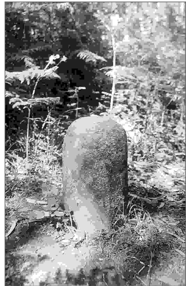
Marco do Salto.

A existencia no pasado doutros moitos marcos, algúns deles xa desaparecidos, aínda é lembrada na comarca. Por exemplo, a capela de San Marcos, na parroquia fenesa de Santa Mariña de Sillobre, foi construída durante o século XIX sobre un lugar onde anteriormente se achaba un marco. Este punto diferenciaba nun primeiro momento distintos coutos xurisdiccionais e posteriormente distintos concellos, concretamente Fene e Cabanas. Esta característica provocou que durante moito tempo a capela de San Marcos fora coñecida como "a capela do marco".