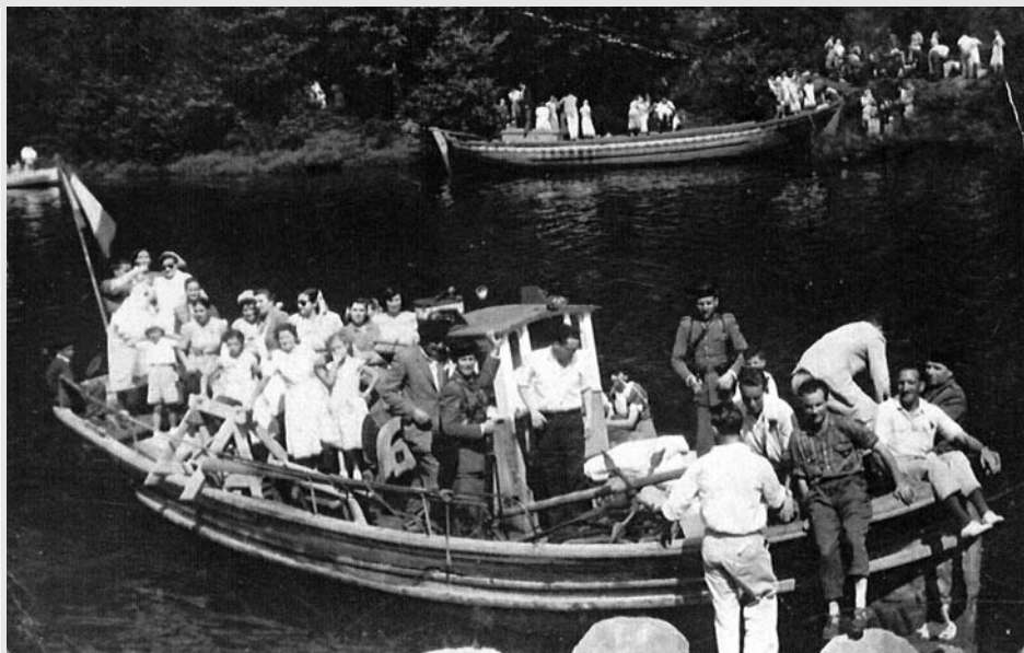
Romería do día da festa do río Eume nos anos 50.