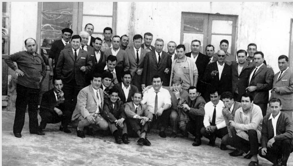
Pescadores na comida en honor do Xefe da Garda Civil de Pontedeume.