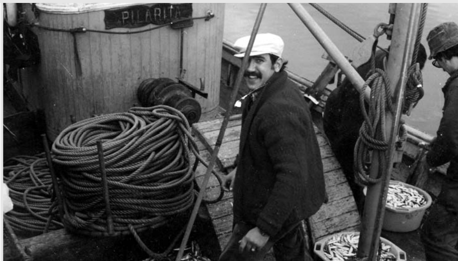
No Pilarita pescando cuns amigos para levar o peixe ó asilo.

Pescan ao cerco: sardiña, xarda, xurelo, bocarte. Ademais da ría de Ares, van pola ría da Coruña e polo Orzán, por fóra do Boi. Dormen todos no barco ou na lancha de remolque. As redes teñen que encascalas cada tres ou catro meses. Deben mergullalas en auga fervida con casca de carballo e mais piche mesturado con chapapote. Fano nos antigos almacéns de Pontedeume. Despois lévanas nun carro, daqueles chamados zorras, a tender, durante cinco ou seis días, no piñeir de Cabanas, ou por riba dos xuncos de Betanzos ou do pazo da Lanra (hoxe denominado de Mariñán).