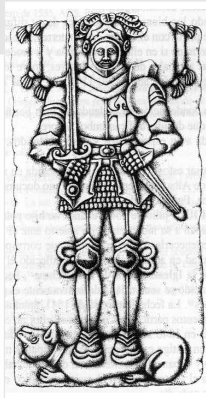
Relevo do sepulcro de Fernando de Andrade que se atopa na igrexa parroquial de Santiago de Pontedeume.

Pero se por encima dunha xesta de tipo militar interésanos resaltar unha das consecuencias políticas máis determinantes destas campañas de Italia é que por primeira vez desde os tempos da Roma clásica existe unha Weltpolitik 43 e é España quen a exerce. En efecto, desde finais do século XV, e de maneira crecente durante século e medio, España está en todas partes. Todos os pobos do Occidente europeo encóntranse con ela, ou nos seus propios territorios ou nas súas empresas.