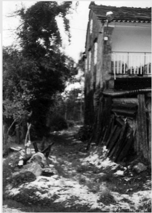
Lugar onde morre Riqueche

trátase do cobro dunha sanción. En agosto do ano anterior os guerrilleiros presentáranse na mesma casa para requirirille ao dono a entrega de 30 000 pesetas. As dificultades para satisfacer o pagamento de 14 000 pesetas que reclaman nesta ocasión, levou aos guerrilleiros a percorrer as casas do lugar para que todos os veciños contribuíran ao pagamento. Despois de recadar unhas 6 000 pesetas, o destacamento abandona a aldea. Volverían unha vez máis, a finais de outubro, para atoparen a morte nunha celada preparada pola garda civil 35 . Por entónces xa fora desarticulado en Oroul (Lugo) o destacamento Segundo Vilaboy. Alí morreron dous antigos camaradas: Juan Pérez (Xan de Xenaro) e Juan Gallego (Comandante).