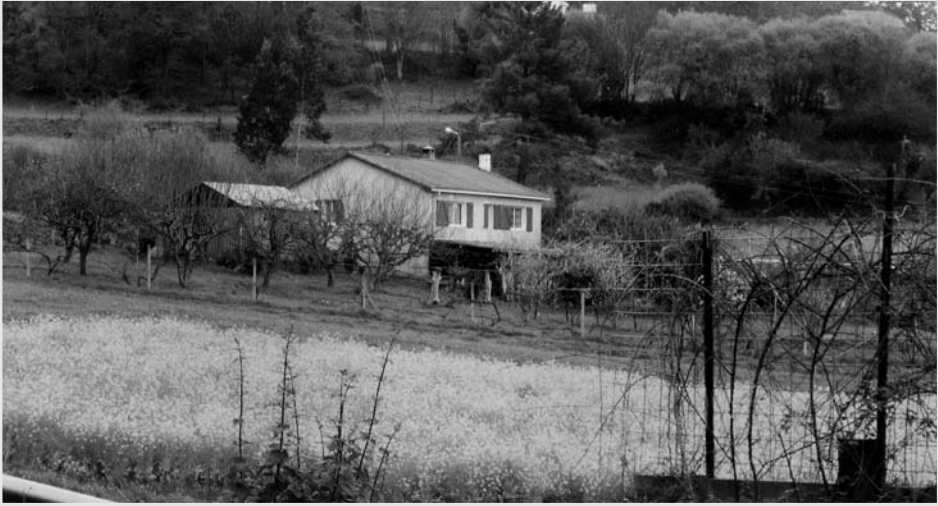
Casa da familia Allegue en A Pallara (Vilarmaior).

chado e recordáballes como petaban no chan coas culatas dos fusís mentres el oía todo.