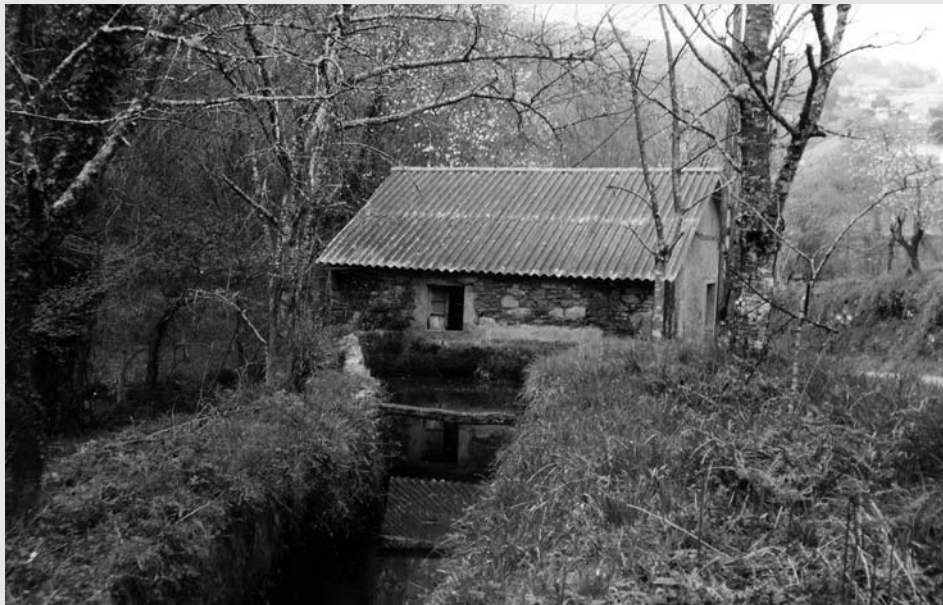
Muíño de Casanova (Vilarmaior)

mente coa intención de matalo. Ao marcharen polo camiño, atopáronse coas forzas da garda civil e comezou entre ambos un tiroteo, que o depoñente aproveitou para fuxir. A arma foi atopada sete meses despois, xunta os cadáveres caídos na casa de Pazos. O terceiro era probabelmente Juan Gallego (Comandante).