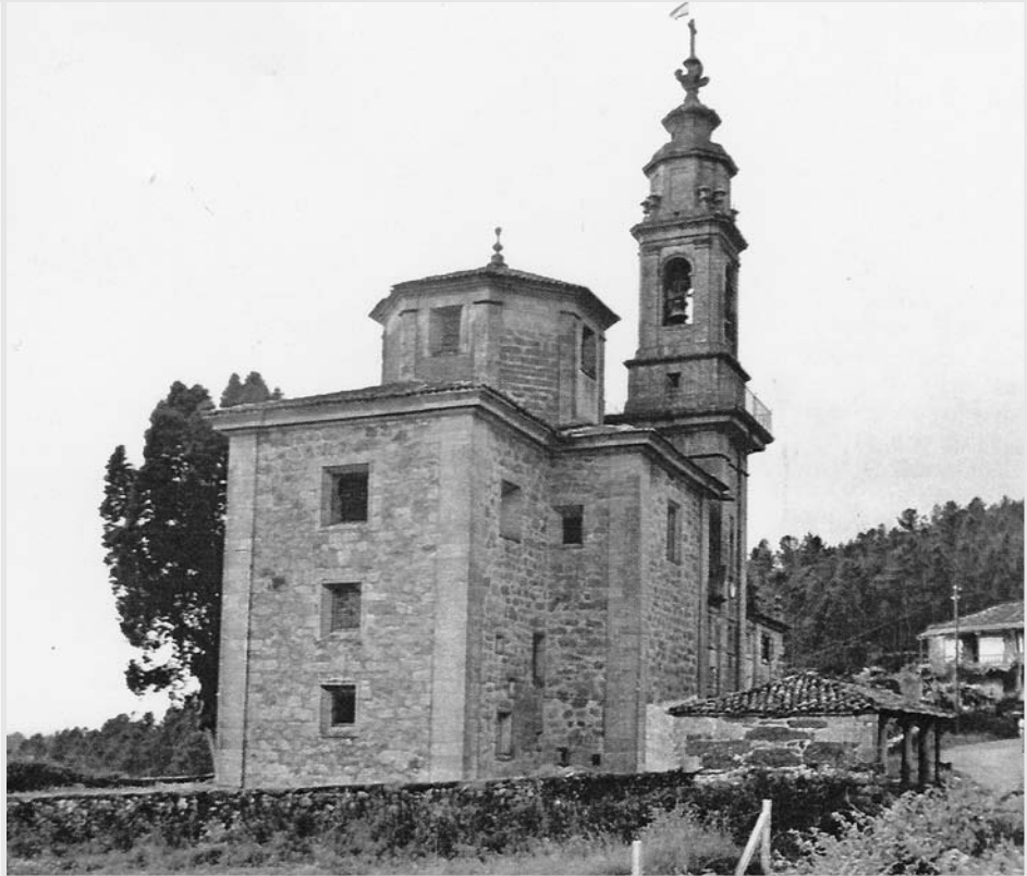
Igrexa dos Desamparados.

aparece compartindo a súa capa cun mendigo. Por riba desta imaxe ábrese unha ventá e, sobre ela, unha decoración de placas.