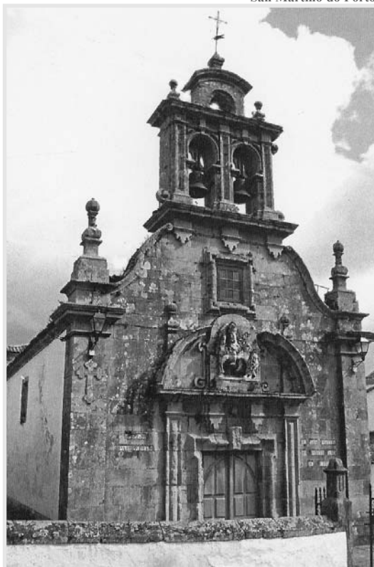
San Martiño do Porto.