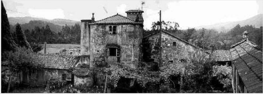
Pazo "A Betarra".

No museo de Pontevedra consérvase un plano de dita carrilería: " Plano del Camino y Plantío Real desde la ciudad de Santiago hasta la villa de Pontevedra ", a cal, segundo Filgueira Valverde supuxo unha grande obra neoclásica que cultivou a paisaxe como un parque ademais de mellorar o estilo de vida da xente. Plásmanse así as ideas estéticas da Ilustración que ofrece algo funcional e, ao mesmo tempo, agradábel á vista, xa que toda a obra está feita con orde e simetría.