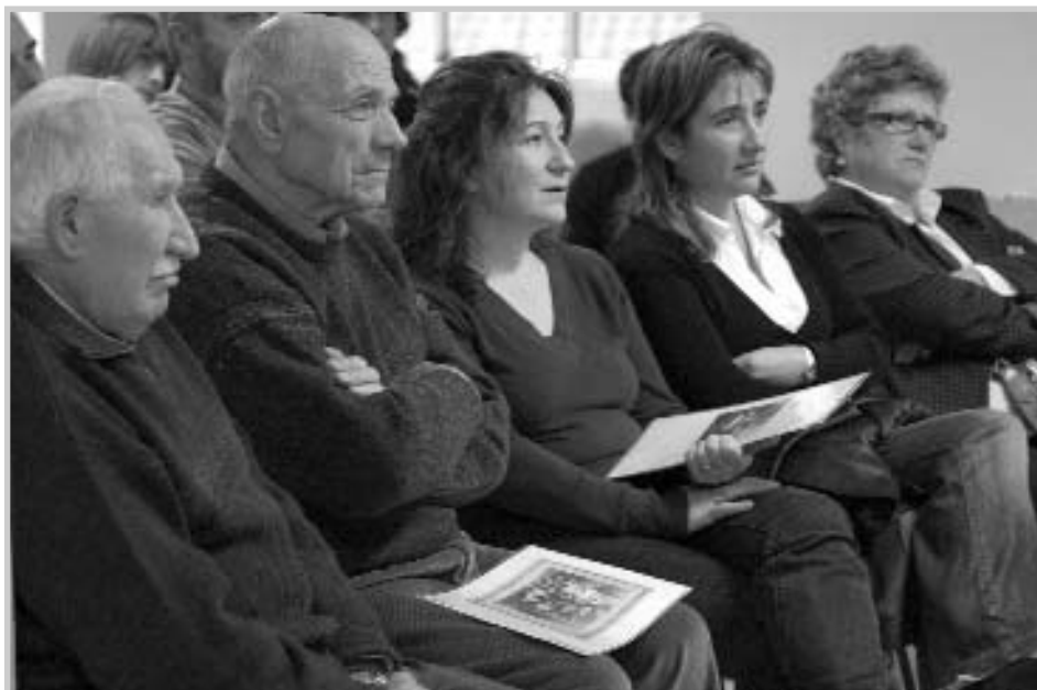
O Fondo só ten sentido se os veciños/as o consideran de autoría colectiva