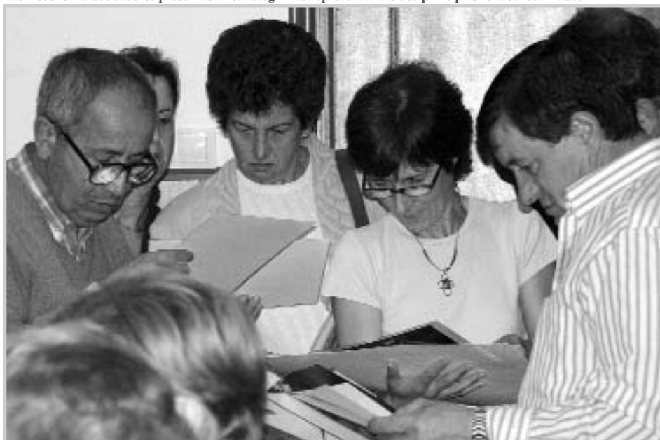
Nas Recolleitas dos saberes presentábase fotografías representativas dos principais fondos localizados