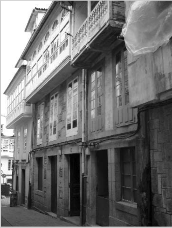
Sede da Sociedade de Oficios y Profesiones Varias na rúa do Empedrado