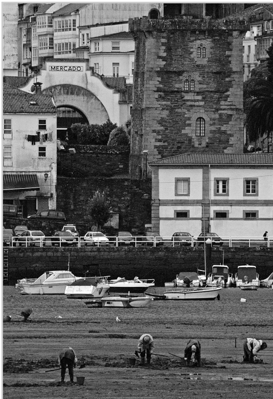
Da exposición "Ondas de Irmandade"