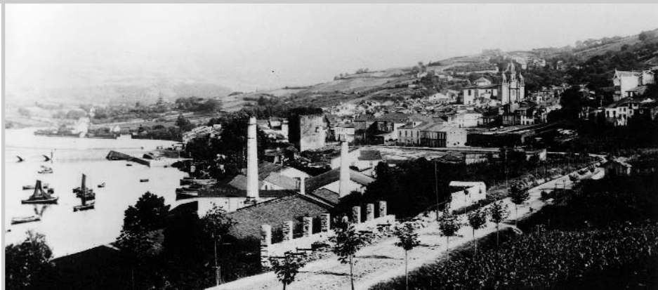
Vista xeral de Pontevedra polos anos 1920 na que aparece o torreón sen restaurar e o pazo dos Andrade aínda en pé, no centro da vila, ao lado do torreón