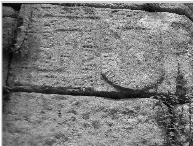
Escudos do castelo de Nogueirosa

Non obstante, Fernán Pérez utiliza as dúas variantes do escudo, con banda e sen ela. Estas dúas variantes vémolos en San Francisco de Betanzos, reproducidas nos muros laterais da ábsida, nos relevos que desenvolven o tema cinexético iniciado nos laterais da sarcófago deste prócer. En cambio, nos lados menores do cenotafio, só figura o escudo con banda; o escudo que corresponde á cabeceira do sarcófago está sostido por dous anxos, tocados co bordón franciscano, mentres que o escudo situado na parte que corresponde aos pés ocupa todo o campo.