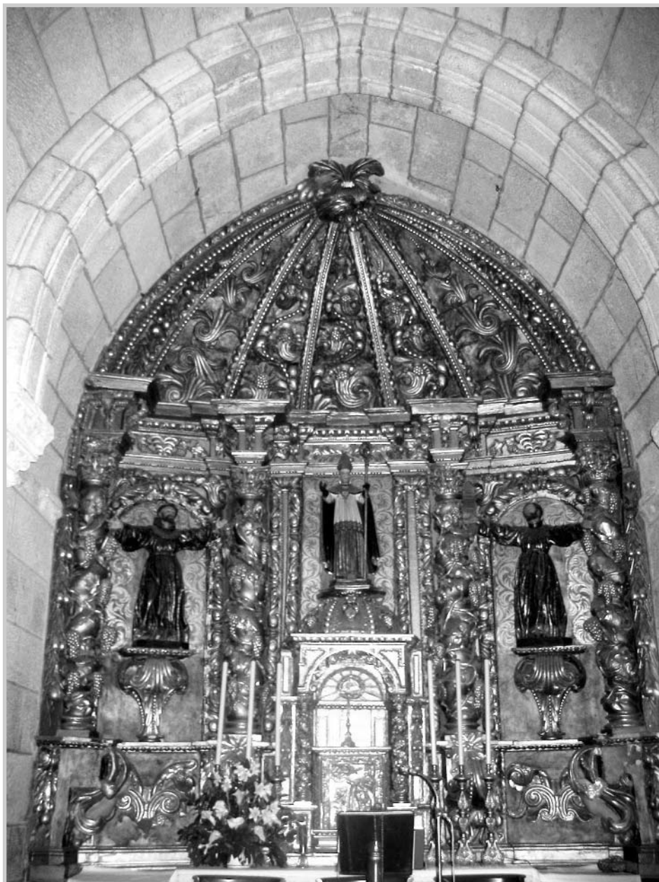
Retablo mayor de la Iglesia de San Eusebio.