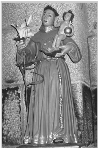
Imagen de San Antonio en la Iglesia de San Eusebio.

En resumen, apenas unos detalles de la actividad profesional de un maestro dorador y pintor que se dice vecino de Pontedeume y que sin duda enriquece la nómina de artistas nacidos o avecindados en la feliz villa de los Andrade.