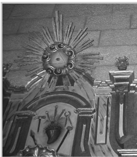
Detalle de la cabecera del retablo del Santo Cristo en la Iglesia de San Eusebio.