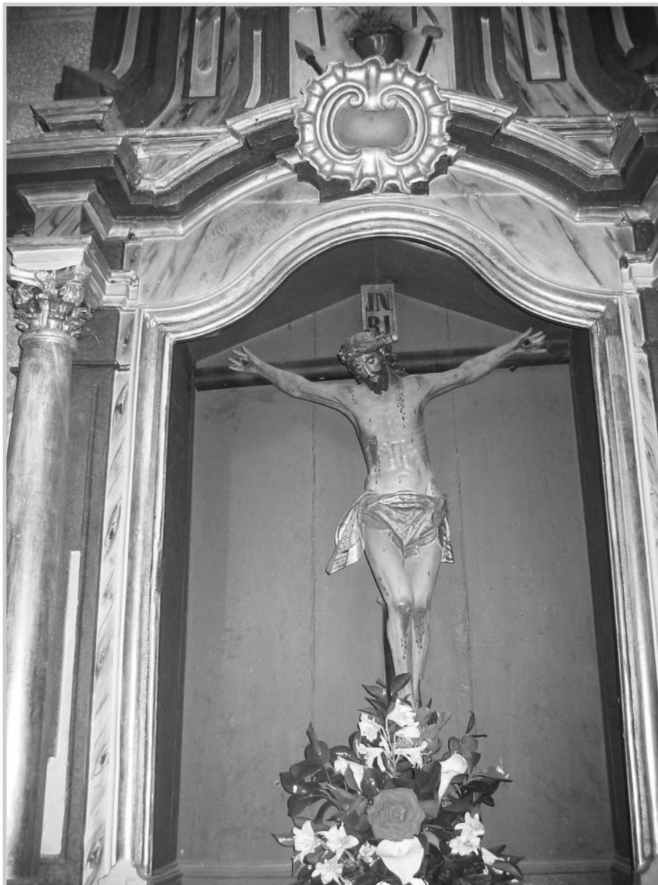
Retablo del Santo Cristo en la Iglesia de San Eusebio.