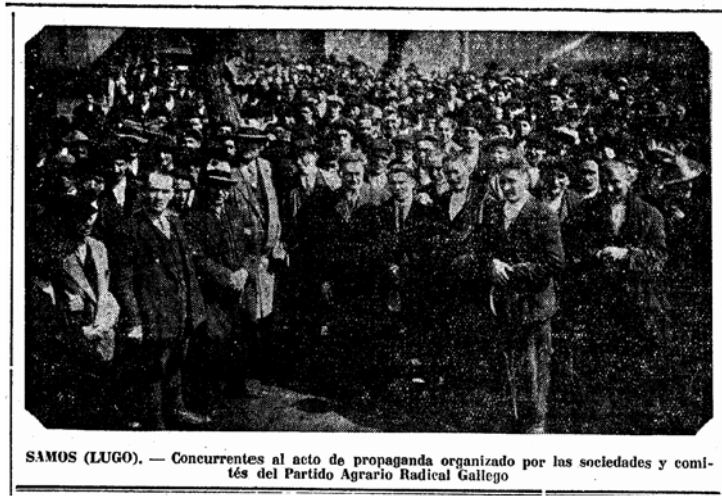
SAMOS (LUGO). — Concurrentes al acto de propaganda organizado por las sociedades y comités del Partido Agrario Radical Gallego