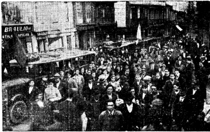
UNA IMPONENTE COMISION DE LABRADORES VINO AYER EN AUTOMOVILES A LA CORUSA

“Protesta contra o monopolio do transporte na Coruña”, 1932