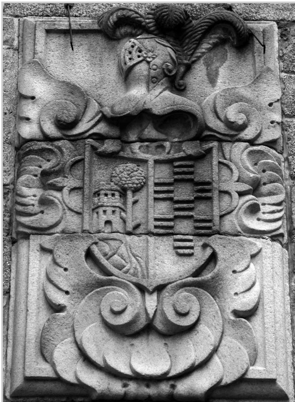
Armas de los Piñeiro de Ulloa. Betanzos