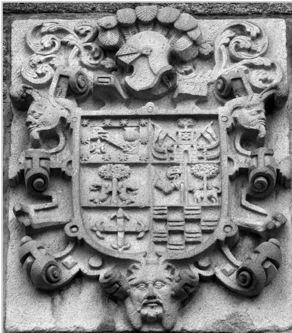
Escudo en la Casa de los Marqueses de Bendaña. Betanzos