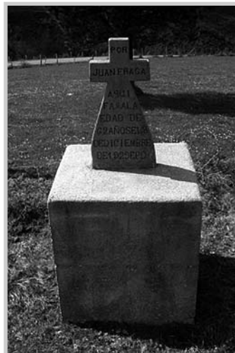
Cruz da Cabana