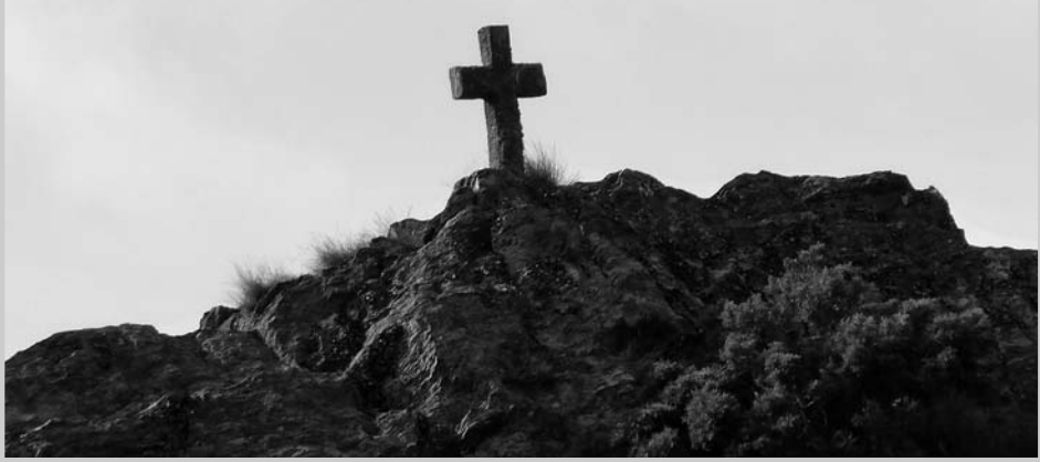
Cruz de Suapena

latina e boa feitura, ten o seus paus lisos e de sección rectangular, aparecendo neste momento completa e ben conservada.