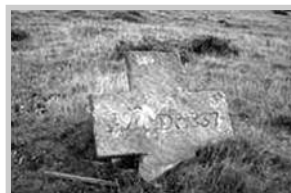
Cruz de Gosende

Seguindo o Camiño dos Arrieiros pódese contemplar a Cruz de Suapena ou de Bidueiro, que aparece colocada no alto dun outeiro, na parte superior dunha agrupación de rochas de lousa, sacralizando un conxunto de túmulos que Francisco Maciñeira identificou como o grupo tumulario do Bidueiro. A rechamante cruz de pedra, que salienta recortada no horizonte, é de forma