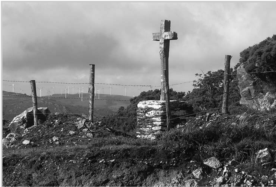
Cruz de Prada

Entre as cruces de pedra que aínda sobreviven nesta antiga ruta, situada moi próxima á anterior, atopamos, unha vez deixado atrás o Alto do Caxado, nun cruce en plena estrada, dentro da parroquia de San Xoán de Freixo nas Pontes, a Cruz de Prada chamada así polo nome de familia do seu construtor. Trátase dunha cruz alta e de bo tamaño, feita de pedra de Moeche ou serpentina, levantada sobre un amplo pedestal cuadrangular feito de laxes de cachotería. Semellando carecer do capitel, sobre un varal relativamente curto coas súas arestas marcadamente oitavadas, vai colocada unha sólida cruz de forma grega que ten os seus remates lixeiramente florenzados, aparecendo espida de imaxes.