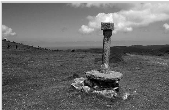
Cruz de Pena Branca

Unha nova obra do Camiño dos Arrieiros, situada na parroquia das Ribeiras de Sor, atópase tamén neste intre esnaquizada, o Cristo de Pena Branca, situado preto dunha fonte e ao pé da subida a un outeiro sacro, no cruce do camiño co vieiro que leva a Pena Branca e Pastoriza, ergueita tamén noutra chaira