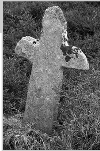
Cruz de Chande de Armada

Facendo un desvío cara á freguesía de San Xoán de Freixo, na praza do lugar pódese ver un interesante exemplar, levantado o ano 1793 pola familia dos Montenegro, segundo amosa unha inscrición moi esvaecida. Levántase sobre unha plataforma de dous monumentais graos de bastas laxas de lousa e un curto pedestal resolto por unha escocia e unha moldura toroidal. A columna de arestas biseladas e o falso capitel soportan unha cruz de extremos bifurcados con remates de semiesferas. A imaxe de Cristo na cruz é de formas esveltas, estando pegado ao madeiro e exposto como morto, cos pés cravados sobre una caveira, símbolo da morte. A efixie da Virxe, orante e de formas estáticas, é máis sinxela e pequena, colocada dentro dun forno.