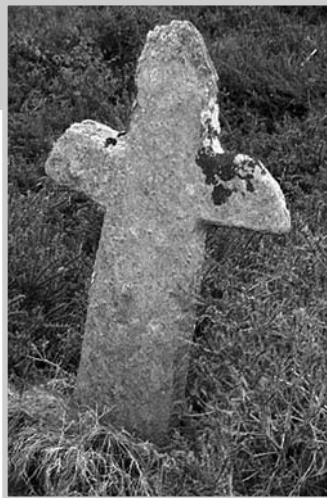
Cruz de Chande de Armada

Facendo un desvío cara á freguesía de San Xoán de Freixo, na praza do lugar pódese ver un interesante exemplar, levantado o ano 1793 pola familia dos Montenegro, segundo amosa unha inscrición moi esvaecida. Levántase sobre unha plataforma de dous monumentais graos de bastas laxas de lousa e un curto pedestal resolto por unha escocia e unha moldura toroidal. A columna de arestas biseladas e o falso capitel soportan unha cruz de extremos bifurcados con remates de semiesferas. A imaxe de Cristo na cruz é de formas esveltas, estando pegado ao madeiro e exposto como morto, cos pés cravados sobre una caveira, símbolo da morte. A efixie da Virxe, orante e de formas estáticas, é máis sinxela e pequena, colocada dentro dun forno.