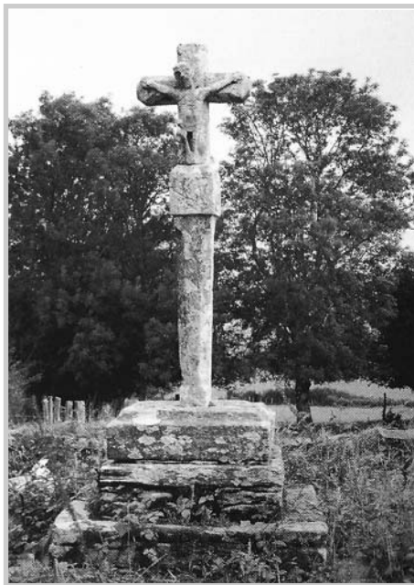
Grañas do Sor

Nun cruce de camiños que leva ás Grañas de Sor, preto de Candedo, atopábase a coñecida como Cruz ou Cristo dos Francos, outro dos exemplares da ruta, citada na súa obra por Federico Maciñeira e outros autores e que segundo diversas informacións foi espoliada nunha nova mostra de agresión ao patrimonio cultural. Facendo un desvío cara á igrexa parroquial de Grañas de Sor, trala ábsida do templo de San Mamede érguese un atractivo cruceiro de formas primitivas. Sobre a plataforma de dous banzos de cachotería e o pedestal prismático aséntase un curto varal oitavado con biseis en punta de frecha. O capitel de caras lisas leva inscritos uns desgastados símbolos da Paixón, os tres cravos, a coroa e o martelo. No crucifixo de paus de remates irregulares aparece á fronte a imaxe de Cristo coroado de espiñas, de labra arcaica e formas expresivas, amosando un marcado patetismo, e no reverso a da Virxe das Dores moi pequena e as penas esbozada.