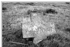
Cruz de Gosende

Seguindo o Camiño dos Arrieiros pódese contemplar a Cruz de Suapena ou de Bidueiro, que aparece colocada no alto dun outeiro, na parte superior dunha agrupación de rochas de lousa, sacralizando un conxunto de túmulos que Francisco Maciñeira identificou como o grupo tumulario do Bidueiro. A rechamante cruz de pedra, que salienta recortada no horizonte, é de forma