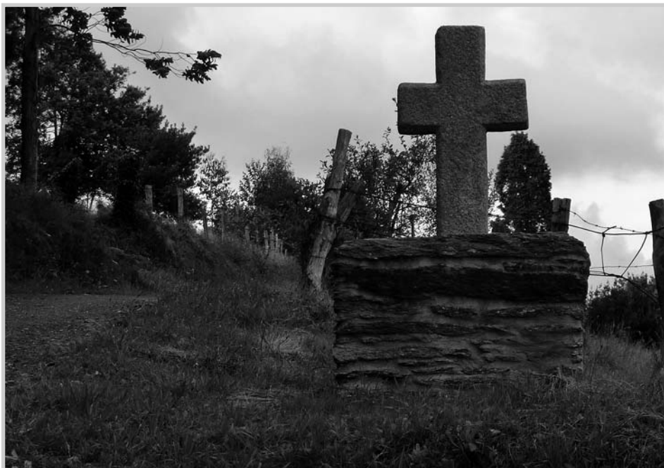
Cruz de Bustelo

Unha nova obra do Camiño dos Arrieiros, situada na parroquia das Ribeiras de Sor, atópase tamén neste intre esnaquizada, o Cristo de Pena Branca, situado preto dunha fonte e ao pé da subida a un outeiro sacro, no cruce do camiño co vieiro que leva a Pena Branca e Pastoriza, ergueita tamén noutra chaira