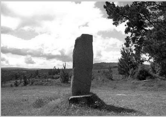
Cristo de Mouraz

Diante das continuas peticións para a restauración desta coñecida cruz de pedra de Mouraz, no seu lugar colóuse unha estraña construción de pedra moi branca que algunha mente quenturenta imaxina que pode sela solución dun novo atentado ao patrimonio. A singular cons-trución non merece outro comentario que dicir que consiste nun piar cadrado, onde aparecen gravados os nomes das catro freguesías que converxen no lugar, unha mesa e catro bancos arredando o devandito piar central.