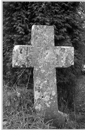
Cruz dos Remedios

A seguinte cruz do itinerario é a coñecida como Cruz da Cabana, situada tamén ao bordo do camiño. Trátase dunha cruz de pedra, sinxela e de curta altura, cos seus paus estreitos e de sección oblonga, sendo o pau inferior dunha forma marcadamente trapezoidal. A cruz atópase colocada sobre unha ampla estrutura cuadrangular que fai de baseamento e a levanta do chan. Neste caso trátase dunha cruz das chamadas de mala morte, lembrando un falecemento accidental ou repentino. Na cara frontal