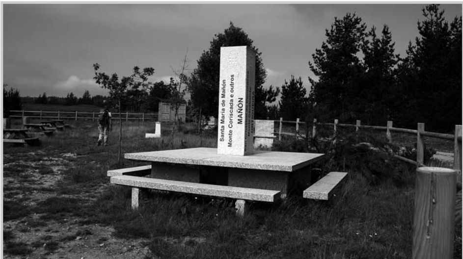
Monumento de Mouraz

Diante das continuas peticións para a restauración desta coñecida cruz de pedra de Mouraz, no seu lugar colóuse unha estraña construción de pedra moi branca que algunha mente quenturenta imaxina que pode sela solución dun novo atentado ao patrimonio. A singular cons-trución non merece outro comentario que dicir que consiste nun piar cadrado, onde aparecen gravados os nomes das catro freguesías que converxen no lugar, unha mesa e catro bancos arredando o devandito piar central.