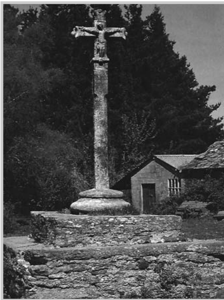
San Xoán de Freixo

Unha nova cruz de pedra, neste intre derrubada e tirada do chan, é a que se atopa nunha revolta do camiño cara a Gosende, preto da vella capela de Pena de Francia. Neste caso trátase dunha basta e rechamante cruz de formas singulares e curta altura, con paus moi amplos e sección moi estreita, no seu momento chantada fortemente no chan. Posibelmente fose levantada por mor dunha mala morte, levando gravada na súa fronte a data de 1837, seguramente o ano no que tivo lugar o falecemento dalgunha persoa nese sitio, seguindo o ancestral costume de moitos levantamento dunha sinxela cruz, normalmente de pedra, o falecemento accidental dalgún camiñante.