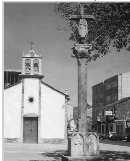
Capela do Carmo

Comezamos este percorrido a carón dun tradicional cruceiro situado practicamente ao inicio do camiño, ergueito na ampla praza fronte á capela da Virxe do Carmo das Pontes: un interesante exemplar, de curiosas formas e orixinal decoración. Sobre a mesa de altar ou pousadoiro leva un retablo de granito rosa, en forma de dobre fornello de medio punto, coas pouco correntes imaxes en baixorrelevo da Virxe das Dores e a Madalena. O fuste é de forma oitavada e o capitel da clásica orde xónica, adobiado con volutas e cabezas de anxos. As imaxes da cruz, de certa calidade, están moi gastadas. O Cristo baixo letreiro de