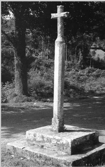
Santa María de Mogor

Unha das últimas cruces de pedra pertencentes a este mítico Camiño dos Arrieiros é o cruceiro de Monteirón, levantado no lugar dese nome pertencente á freguesía de Mogor, situado nunha encrucillada coa estrada que leva dende O Barqueiro ás Ribeiras de Sor. O cruceiro, que se atopa revestido de liques de xeito fermoso, érguese sobre un pequeno pedestal de forma circular e está formado por dúas pezas de granito encaixadas á altura dos brazos da cruz. O tramo longo inferior que fai de varal da obra é de sección cadrada mentres que os brazos da cruz están traballados con chafráns.