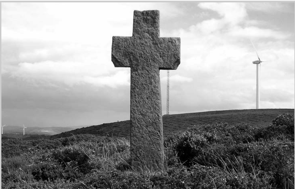
Cristo da Faladoira