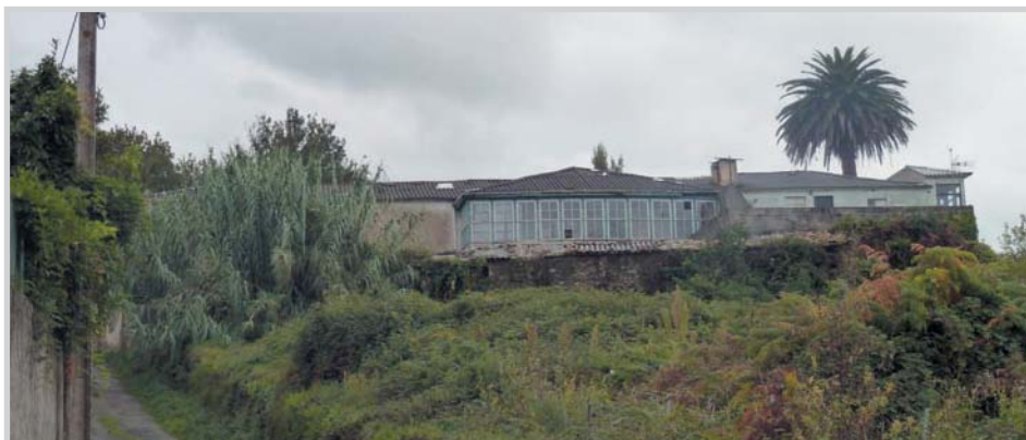
Pazo da Ribeira en Maniños