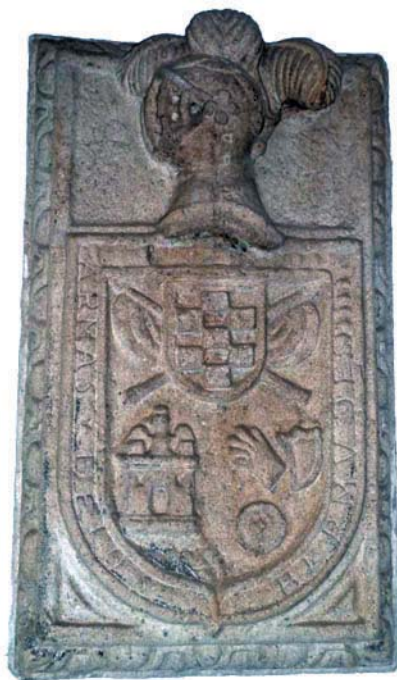
Escudo da familia Bermúdez de Castro pertencente ao Pazo

“...la cual se compone de cocina, casa de horno, salas, corredores, caballerizas de ganados, bodegas corral huerta y palomar circundado sobresi con algunos arboles frutales e infructiferos a la parte del