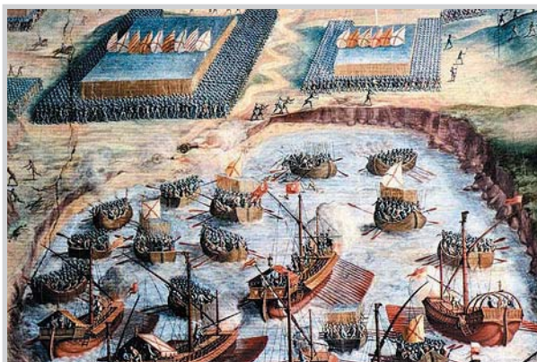
Expedición a Illa Terceira. Monasterio do Escorial