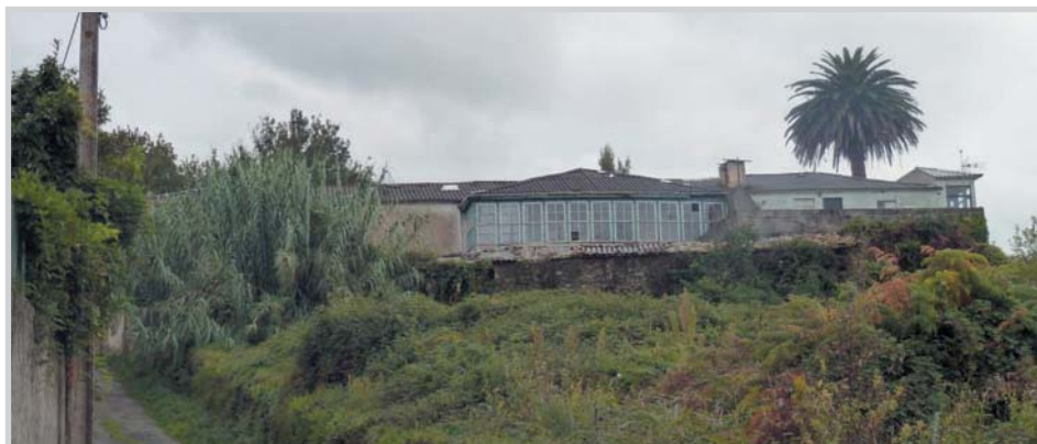
Pazo da Ribeira en Maniños