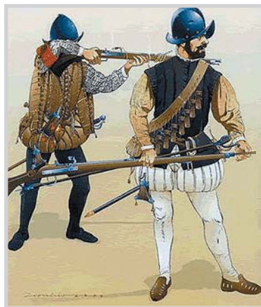
Soldados s. XVI

apresto de las naos de mi Armada por que no se allan ningunos en aquella tierra ni alrededor muchas leguas ni tampoco en portugal y por ser tan necesario que la dicha armada salga a navegar con todad la brevedad pudiere y considerando que estando tan adelante (adelantada) la fabrica de los galeones no serán ahí menester tantos calafates como hasta aqui emvió a mandar al capitan Ojeda que saque de ellos los más que se pudieren y que procurando juntar de otros también los que se pudieren los embie a la dicha Ferrol los unos y los otros con toda la mas brevedad posible en navios pequeños y muy lijeros y para que esto se pueda hazer con la que se desea le embio dos mil ducados y por que para ello habrá menester vuestro favor y ayuda os mando que se lo hagais dar asistiendole a todo, y ayudando por una parte lo que se pudiere pues veis de la importancia que es el llegar alla con mucha brevedad, que en que assi lo hagais me servireis mucho " 2 .