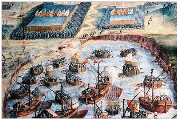
Expedición a Illa Terceira. Monasterio do Escorial