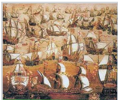
A Armada na Xornada de Inglaterra, no primeiro plano o "San Martín"

polo seu emprazamento xeográfico, as mellores condicións para o cumprimento destas misións” 1 .