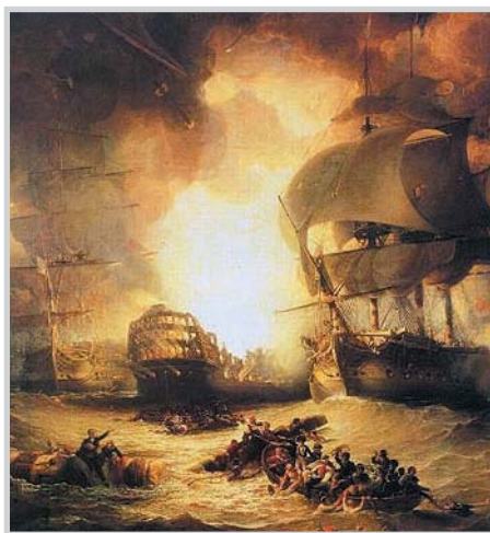
Ataque ao Revenge

No verán de 1591, Felipe II ordena que unha flota cruce o Atlántico en dirección a Novo Mundo, os ingleses tiveron noticia desta navegación e decidiron apostarse, cunha gran escuadra de galeones e mercantes corsarios ao mando de Howard, nas inmediacións das Azores. En agosto partiron da Península 52 naves de Alonso de Bazán e 6 filibotes portugueses, ao chegar ás Azores foron avisados da localización dos buques ingleses e estes igualmente dos españois; Alonso de Bazán dividiu as súas tropas para atacar á flota inglesa por dúas fronteas. O día 11 de Setembro comezou o ataque, que finalizou coa