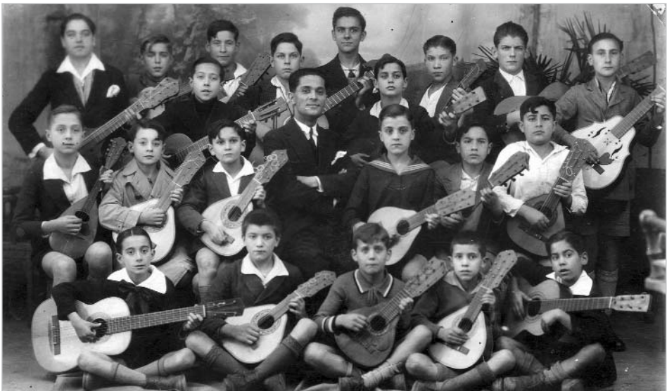
Rondalla da Escola do Pósito de Pescadores. Director: Frutos Fernández Martínez

No tempo de exercer o maxisterio tamen creou unha rondalla formada por alumnos, que participaron en festivais e en comparsas como Petits Bufóns no ano 1932, e Siglo de Oro en febreiro de 1934.