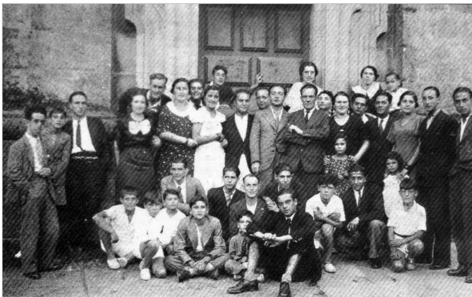
Euterpe na porta da igrexa