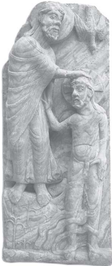
Bautismo de Cristo. Románico, S. XII. FD/N/00710 (MAN)