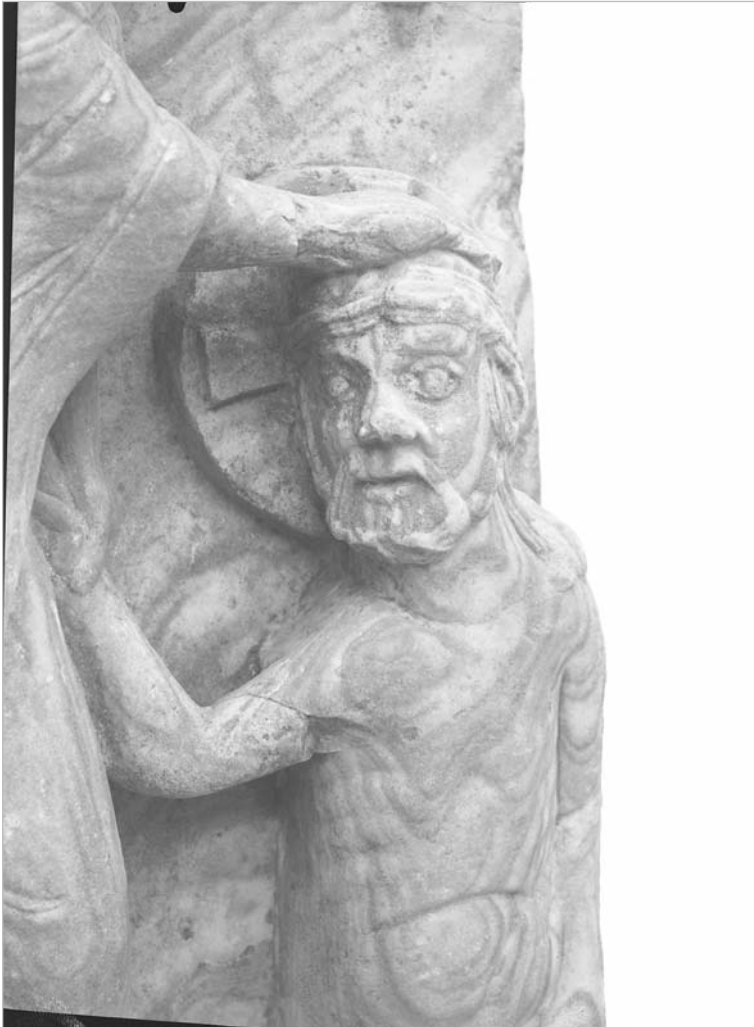
Pormenor do bautismo de Cristo. FD/N/00711 (MAN)