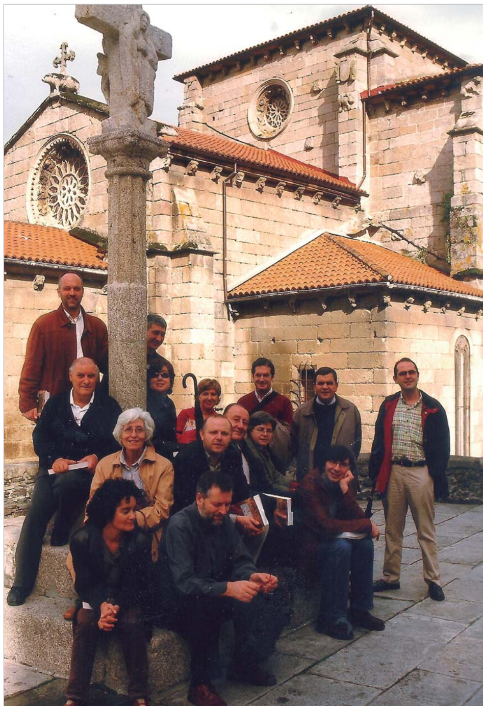
Visita de la Asociación de Estudios Históricos a Betanzos (26-10-2002)