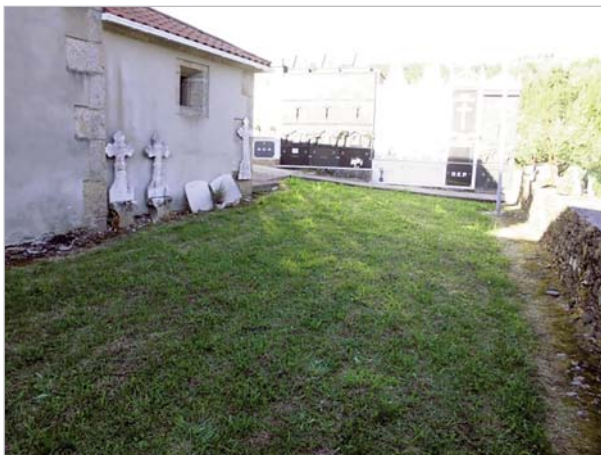
Cementerio en Igrexario (S a Eulalia de Soaserra) en donde está enterrado Ramiro Grande, en zona "no sagrada", apartado de los nichos de la zona sagrada