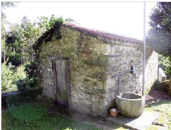
Casucha al lado de la iglesia anterior donde los forenses practicaron la autopsia de Ramiro Grande y de aquellos que morían de repente o de manera violenta